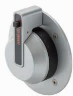
Gashendel € 1.000 Sail Side Mount