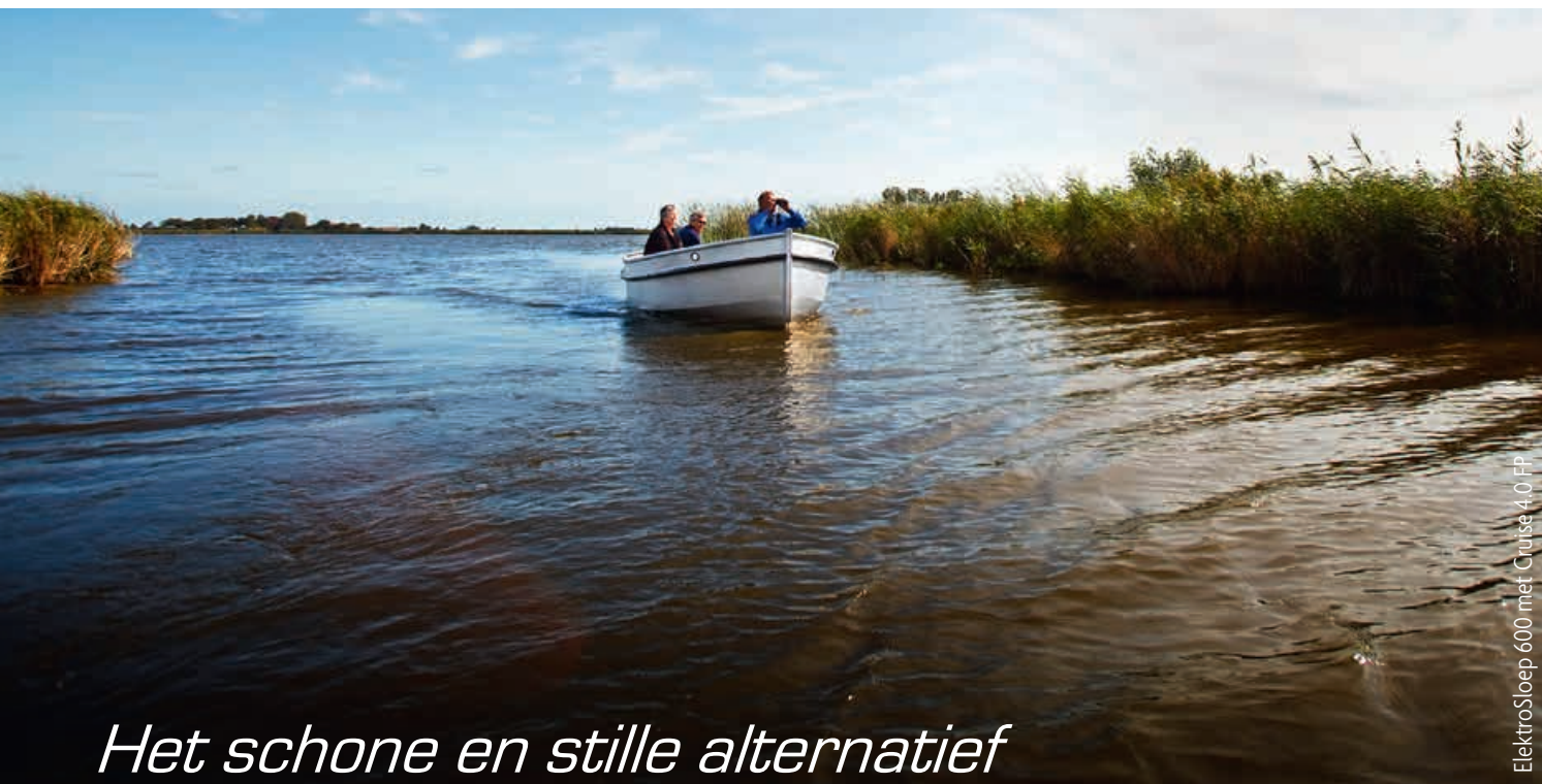
ElektroSloop 600 met Cruise 4.0 FP

Realiseert u zich wel dat elke boot anders is. Een slanke, lichte boot vaart bijvoorbeeld efficiënter dan een brede en zware. Maar ook het vaargebied is van belang. Bij varen op beschut water en voor kortere afstanden kan een lichtere motor toegepast worden dan bij varen op ruim water. Raadpleeg hiervoor altijd uw dealer.