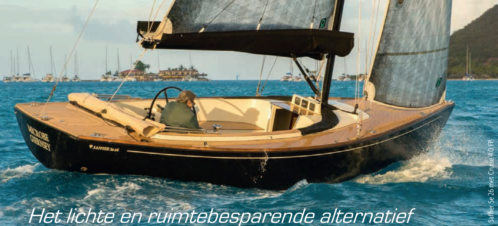
Saffier Se 26 met Cruise 4.0 FP