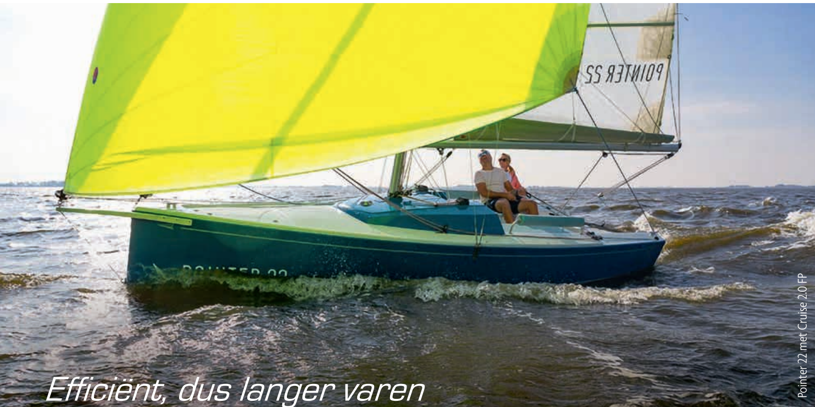
Pointer 22 met Cruise 2.0 FP

Welk accupakket u ook kiest, hoe lang u ook wilt varen, laden kunt u altijd in één nacht . Dus: 's avonds uw boot aan de walstroom, de volgende ochtend weer helemaal volgeladen. Hoe groter de capaciteit van de accu's, hoe groter namelijk het laadvermogen van de lader die daarbij hoort. Laden tijdens het varen kan ook: door de meedraaiende schroef als u voldoende snelheid heeft, maar ook via bv. zonnepanelen of een generator.