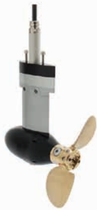
2.0/4.0 FP met klapschroef