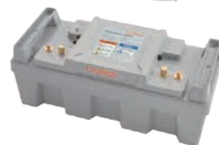
Power accu 24-3500