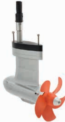
Cruise 10.0 FP