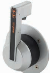
Gashendel € 1.225 Motor Side Mount