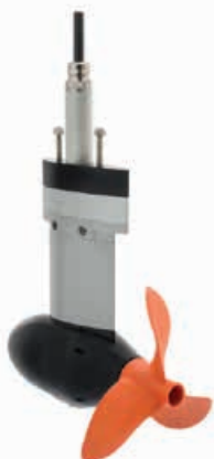
Cruise 2.0/4.0 FP