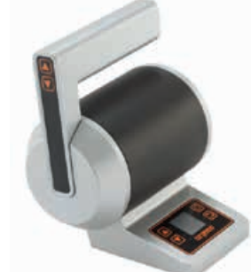
Gashendel € 1.325 Top Mount