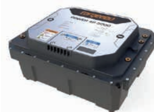
Power accu 48-5000