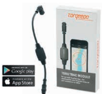
Torq Trac € 135 smartphone app + bluetooth zender

Prijzen van loodaccu's, laders en systeemcomponenten: zie De Stille Boot Accu Prijslijst 2019.